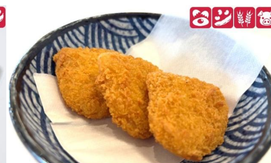
北見たまごころ 350円(税込) Onion croquette 350 yen