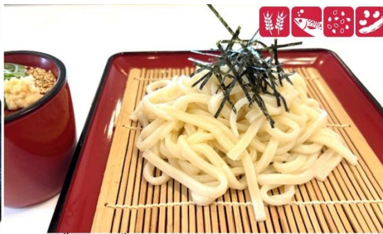
ざるうどん 750円(税込) 大盛ざるうどん 950円(税込) Zaru udon (M) 750yen/ (L) 950yen