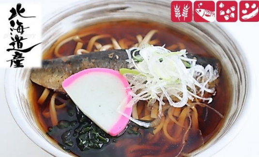
にしんそば 1,100円(税込) 大盛にしんそば 1,300円(税込) Nyshin Soba (M) 1,100yen/ (L) 1,300yen