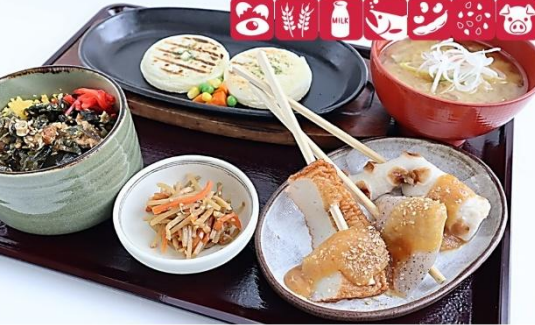
屯田兵定食 1,300円(税込) Tondenhei Set Meal 1,300 yen