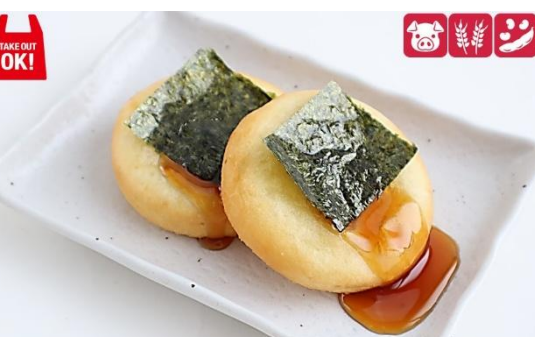
いももち(1個)/Take Out 220円/230円(税込) いももちダブル(2個)/Take Out 430円/440円(税込) Potato Rice Cake (1P) 220yen/ (2P) 430yen