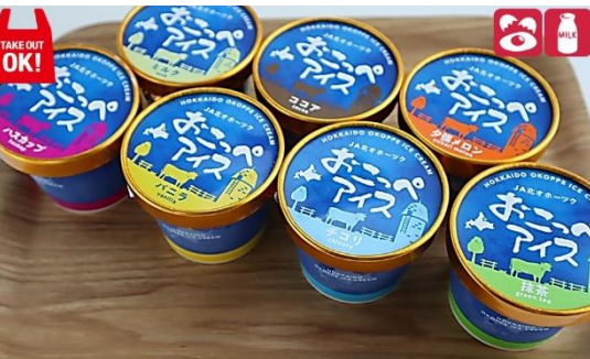
おこっぺアイス(各種) 340円(税込) Okoppe ice 340yen

ドリンクメニュー コーヒー(ホット・アイス) 400円 紅茶(ホット・アイス) 400円 ビートサイダー 270円 ガラナ 270円 ラムネ 270円 サッポロクラシック 680円 シャーベット 140円