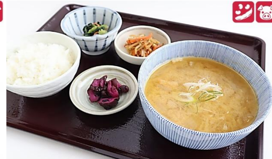
とん汁定食 950円(税込) Tonju Set Meal 950 yen