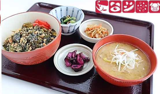
やん衆定食 1,000円(税込) Yanshu Set Meal 1,000 yen