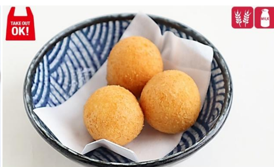
ポテトチーズ/Take Out 430円/440円(税込) Potato cheese 430 yen/440yen