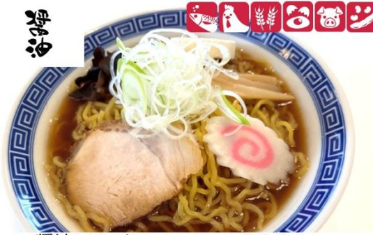
醤油ラーメン 900円(税込) 大盛醤油ラーメン 1,100円(税込) Soy Sauce Ramen (M) 900 yen/ (L) 1,100yen

表示価格は全て税込です(店内提供メニューのため消費税は10%です) ※一部商品除く(テイクアウト時にはお申し出ください)