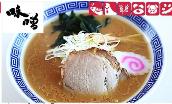
さっぽろ味噌ラーメン 900円(税込) 大盛さっぽろ味噌ラーメン 1,100円(税込) Sapporo Miso Ramen (M) 900yen/ (L) 1,100yen