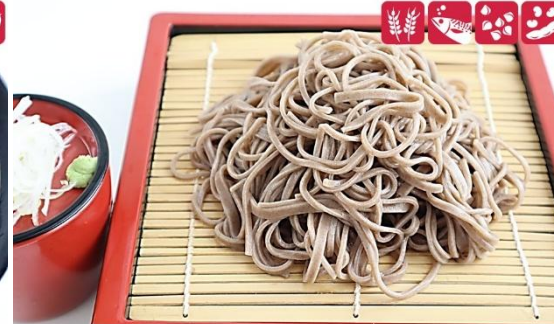
もりそば 750円(税込) 大盛もりそば 950円(税込) Mori Soba (M) 750yen/ (L) 950yen