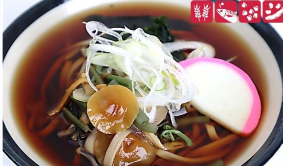
山菜きのこそば 900円(税込) 大盛山菜きのこそば 1,100円(税込) Mushroom Wild Vegetable Soba (M) 900yen/ (L) 1,100yen