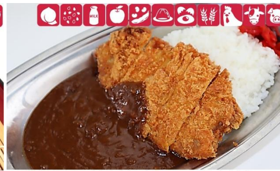
手仕込みロースカツカレー 1,150円(税込) 大盛手仕込みロースカツカレー 1,250円(税込) Katsu Curry (M) 1,150yen/ (L) 1,250yen