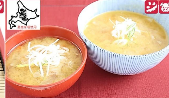
とん汁 350円(税込) / とん汁(大) 580円(税込) Tonjiru 350 yen / Tonjiru (Large) 580 yen