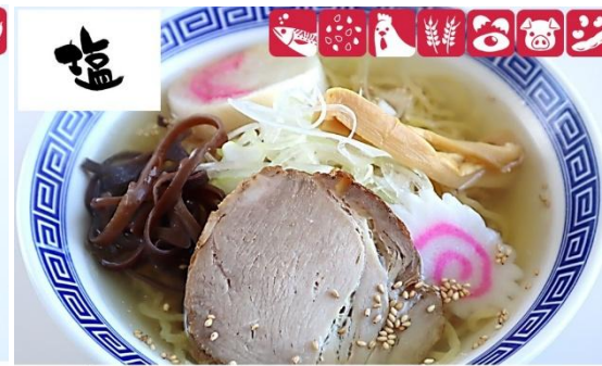
しおラーメン 900円(税込) 大盛しおラーメン 1,100円(税込) Shio Ramen (M) 900 yen/ (L) 1,100yen