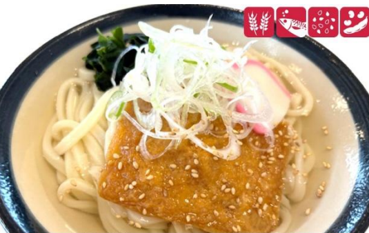
きつねうどん 830円(税込) 大盛きつねうどん 1,030円(税込) Udon with deep-fried tofu (M) 830yen/ (L) 1,030yen