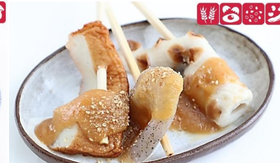
みそおでん 450円(税込) Miso Oden 450 yen