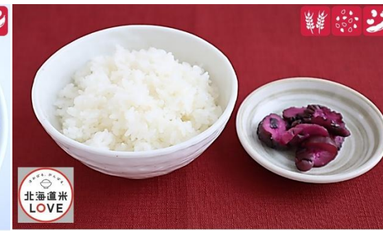
ライス 220円(税込) / 大盛ライス 300円(税込) Rice 220 yen / Rice (Large) 300yen