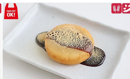
黒蜜きなこもち(1個)/Take Out 240円/250円(税込) Black Honey Kinako mochi (1P) 240yen/250yen