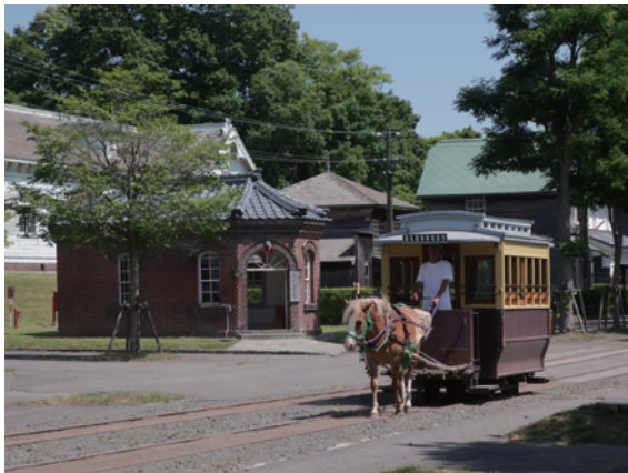
馬車鉄道(夏季) 4月中旬～11月