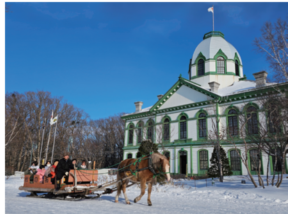
馬そり(冬季) 12月中旬～3月の土日祝、さっぽろ雪まつり期間 ※積雪時のみ運行