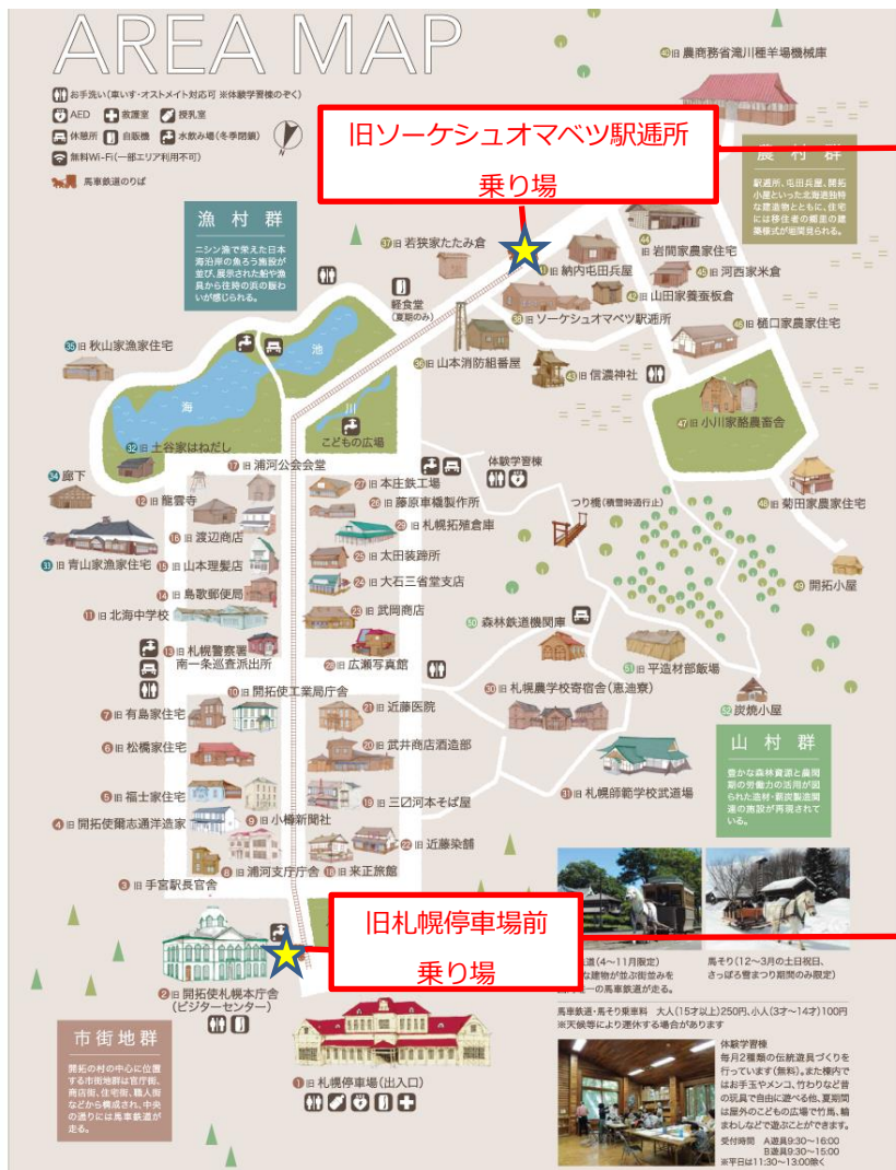
旧ソーケシュオマベツ駅通所前 出発時刻