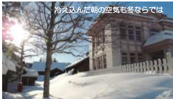
冷え込んだ朝の空気も冬ならではの

寒く雪深い、そして長い北海道の冬。ついつい暖かい室内で過ごしがちになりますが、開拓の村で、昔の北海道の冬を楽しんでみませんか。 冬至やお正月、ひなまつりなどといった年中行事、昔の除雪道具や雪遊び道具などが体験できる「冬の生活体験」など、この冬も開拓の村ならではのイベントを多数ご用意しています。 また、冬ならではの風物詩としては「馬そり」も欠かせません。かつて冬季の運搬・交通手段だった「馬そり」に乗って村内を見学するのもおすすめです。馬そりは、12月積雪時から3月までの土・日・祝日とさっぽろ雪まつり（大通会場開催期間）の平日に運行し、乗車料は、大人250円、小人100円となります。 冬の開拓の村もぜひお楽しみください。