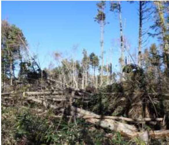
⑧瑞穂連絡線(西) 台風通過後