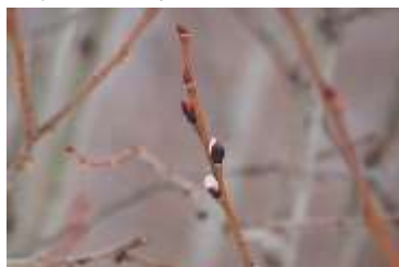
エゾノバッコヤナギ